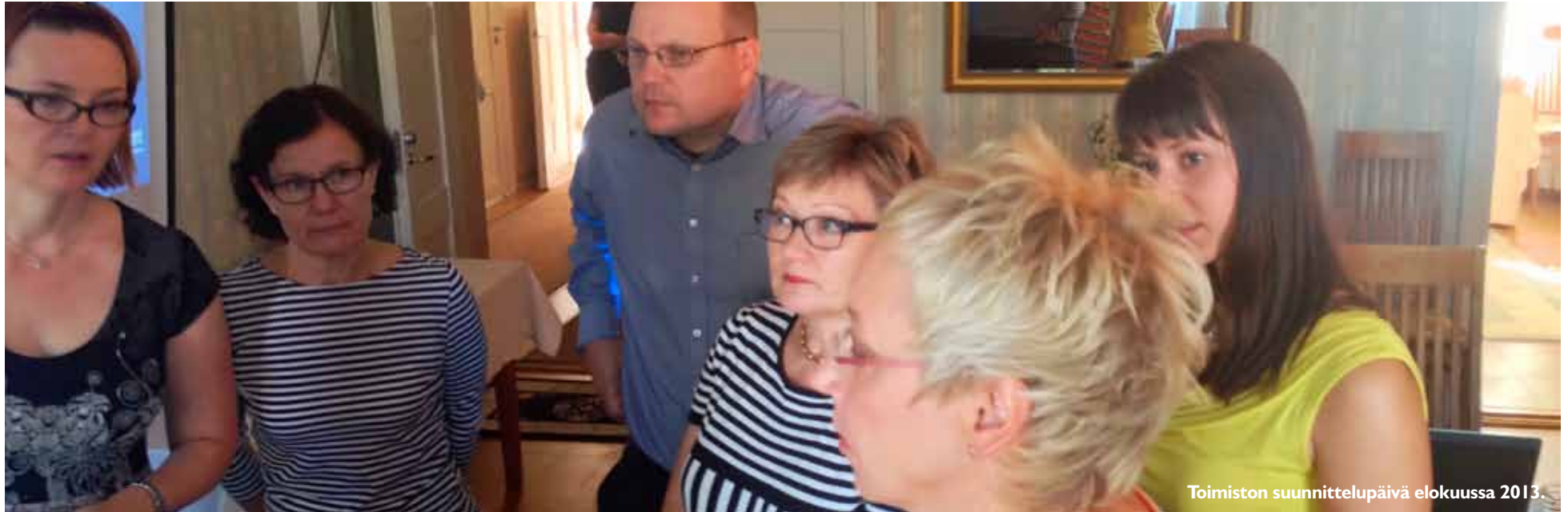
Toimiston suunnittelupäivä elokuussa 2013.