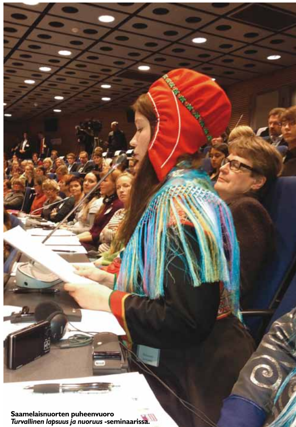
Saamelaisnuorten puheenvuoro Turvallinen lapsuus ja nuoruus -seminaarissa.