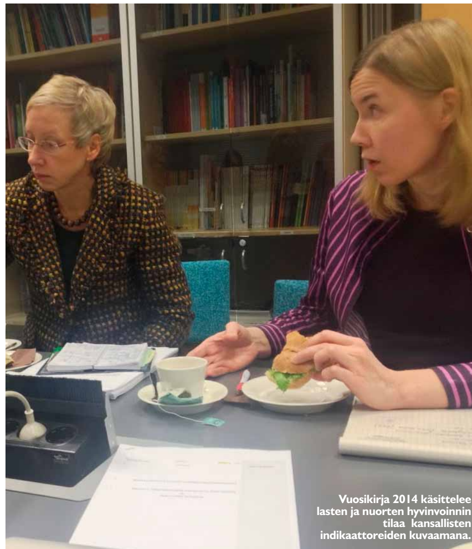
Vuosikirja 2014 käsittelee lasten ja nuorten hyvinvoinnin tilaa kansallisten indikaattoreiden kuvaamana.