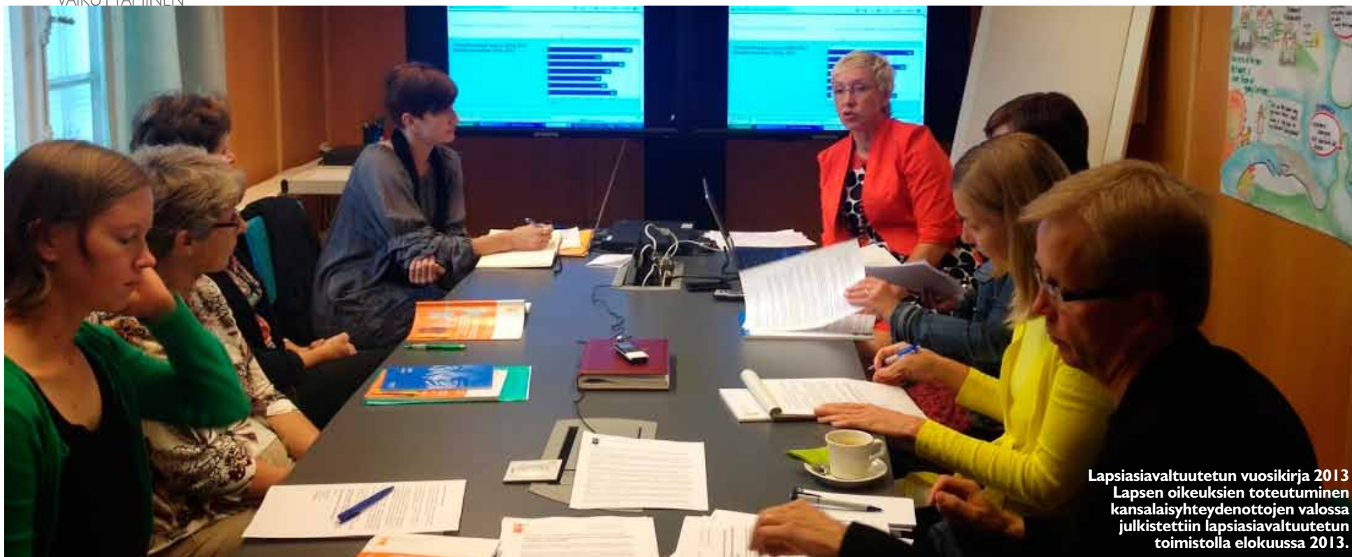
Lapsiasiavaltuutetun vuosikirja 2013 Lapsen oikeuksien toteutuminen kansalaisyhteydenottojen valossa julkistettiin lapsiasiavaltuutetun toimistolla elokuussa 2013.

Lapsiasiavaltuutettu tekee yhteistyötä eduskunnan oikeusasiamiehen kanssa tavoitteena oikeusasiamiehen toiminnan lapsiystävällisyyden lisääminen (tiedotus, lasten ja nuorten kuuleminen lastensuojelulaitosten tarkastuksissa). Yhteistyötä tehdään valmistautumisessa niin sanottu OPCAT -lisäpöytäkirjan toimeenpanoon Suomessa. Uudet toimintamallit vaikuttavat erityisesti laitosten tarkastuksiin ja mahdollistavat esimerkiksi vertaisarvioitsijoiden käytön.