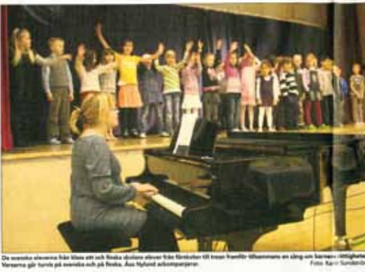
De svenska elevena från Åbo och finska skolorna elever från Torsholm till Irja Pentti för Åbo skolorna en sång om barnens rättigheter. Nerevare går fram på scenen och på Reha, Ann-Majlund och på scenen.