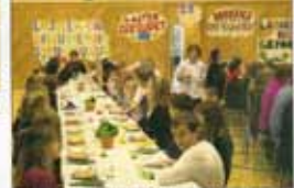
Föräldrarna svarar på frågor i Centralskolan i Örebro. Elevena sitter kring bordet. Finns skolorna elever med svenska skolorna elever, uttrycks av bilderna.