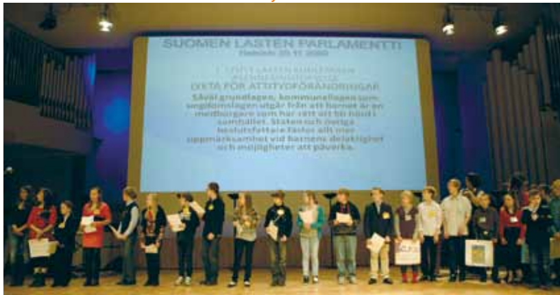
Barnens riksdag i Finlands jubileumssession samlade barn från olika delar av landet till Finlandiahuset i Helsingfors den 20 november 2009.