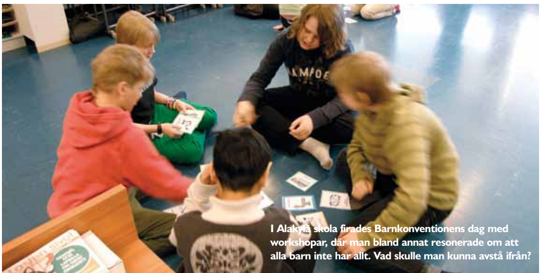
I Alakytä skola firades Barnkonventionens dag med workshopar, där man bland annat resonerade om att alla barn inte har allt. Vad skulle man kunna avstå ifrån?

"Ett nytt sätt skulle vara att lära sig saker genom att undersöka och debattera. Dagens lektionsbaserade struktur skulle kunna delas upp i större studiehelheter för att göra det möjligt att granska ett stort tema eller fenomen ur flera olika läroämnens perspektiv.