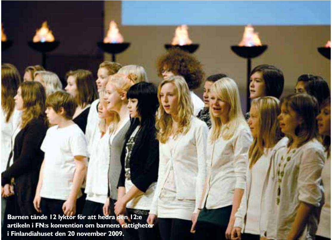
Barnen tände 12 lyktor för att hedra den 12:e artikeln i FN:s konvention om barnens rättigheter i Finlandiahuset den 20 november 2009.