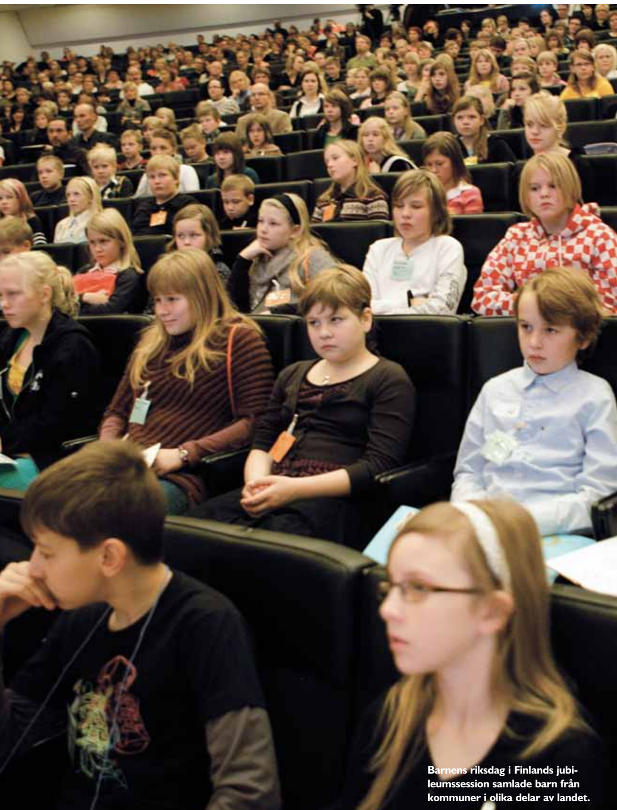
Barnens riksdag i Finlands jubileumssession samlade barn från kommuner i olika delar av landet.